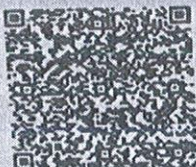
毛玥明年检二维码

本证书经检验合格, 继续有效一年。 This certificate is valid for another year after this renewal.